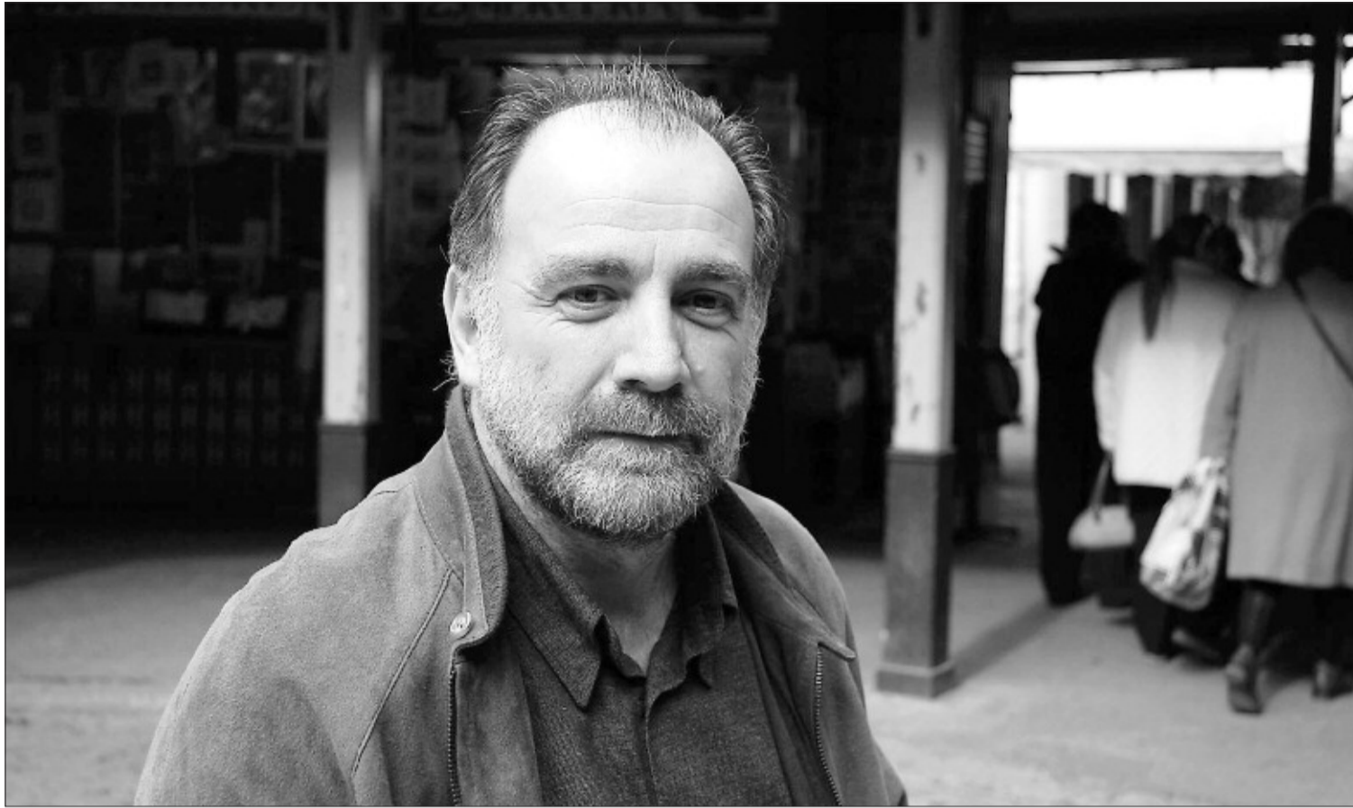
L'escriptor Rafa Gomar.